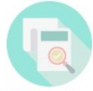
AMC Status Survey