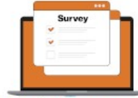
Hitech Classroom Audit 2024