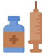
Students Vaccination Status