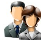
Data Entry Users