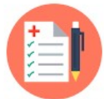
കട്ടികളുടെ ആരോഗ്യ സ്ഥിതി